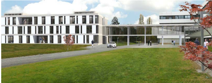
Architekturdarstellung des Start-Up-Accelerator-Gebäudes in Lyon Weitere hochauflösende Aufnahmen auf Nachfrage erhältlich

Interessierte Partner und Start-Ups können das Forschungszentrum erreichen unter contact.accelerate.tech@lafargeholcim.com